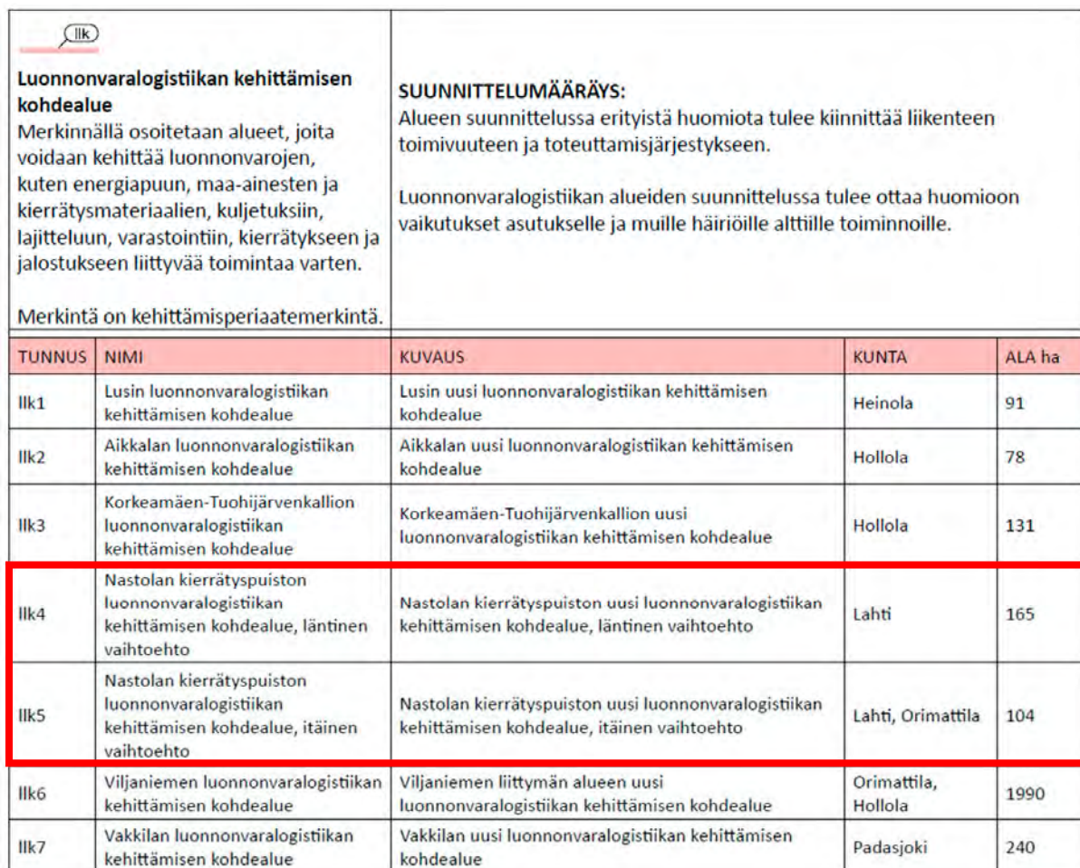
Kuva 1. Luonnonvaralogistiikan kehittämisen kohdealueet.

Päijät-Hämeen maakuntakaavaehdotukseen on merkitty seuraavat luonnonvaralogistiikan kehittämisen kohdealueet (kaatopaikat):