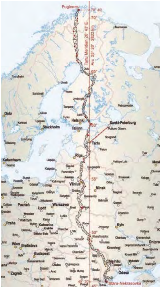
Kaavaselistus. Kuva 48. Struven mittausketju.

Mainittakoon, että Struven ketjun piste Huhmarmäessä tuli mukaan maakuntakaavaehdotukseen Asiantuntijayritys Tieokkaan vaikuttamisen perusteella. Huhmarmäen kaatopaikan konsultti ei lukuisista huomautuksista ja selonteista huolimatta mainitse YVA-arviointiselostuksessa sanallakaan asiaa, mikä on merkittävimpiä perusteita hylätä hanke ja siis hanketaholle äärimmäisen vaarallinen.