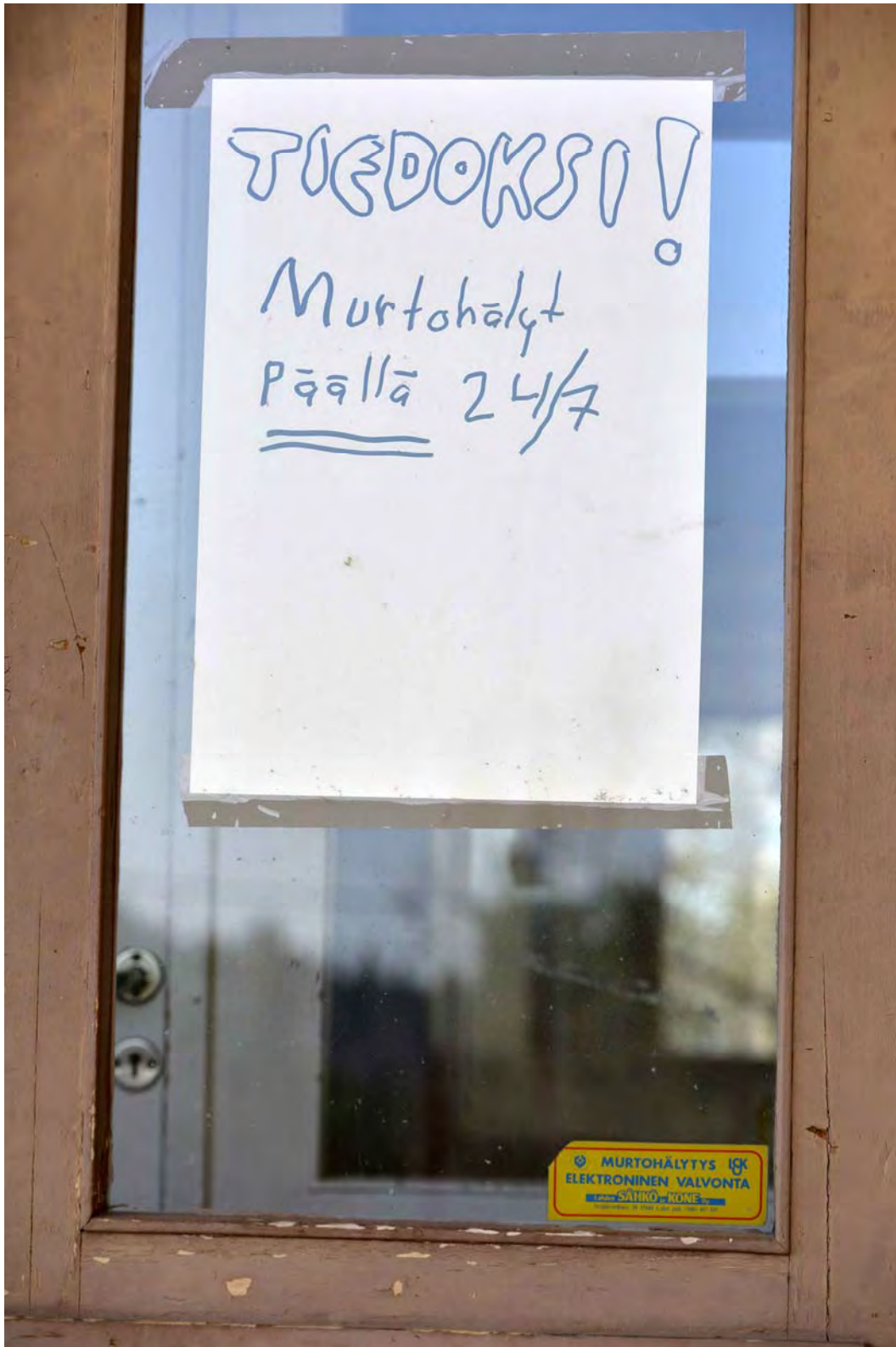
Uudenkylän koulun hälytysilmoitukset. Uusikylä 2020-04-07

Uudenkylän vanha koulu on välittömästi turvattava vahingonteolta, minkä riski on tavattoman suuri. Rakennus ympäristöineen on asetettava tallentavan kameravalvonnan ja sen sisältämän hälytysjärjestelmän piiriin, mistä on näkyvästi ilmoitettava Heinolantien risteyksestä alkaen. Nykyinen järjestely on nollan arvoinen ja houkuttelee tuhotöihin; esim. vanhentuneet yhteystiedot ja merkinnät: